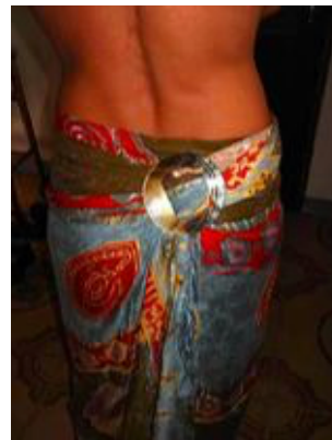
Dies ist ein Lungi oder Pareo