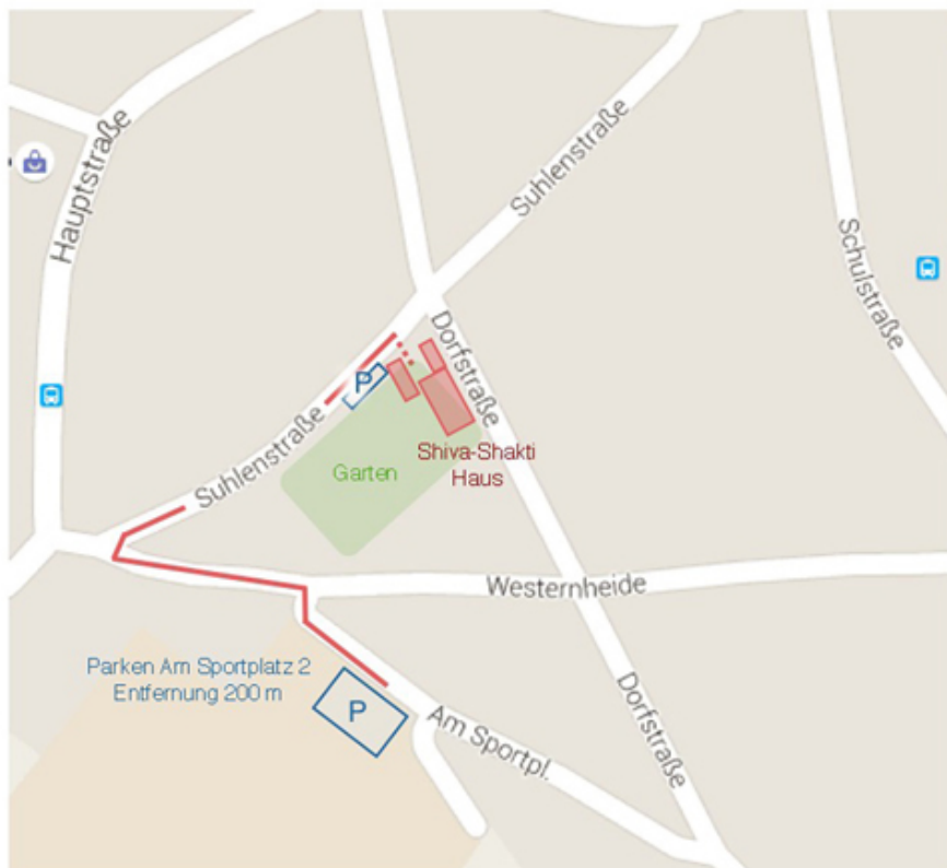
Parken am Sportplatz nachdem die Plätze am Haus gefüllt sind

Bevor du am Sportplatz parkst, bringe einfach dein Gepäck vorher ins Haus Von dort aus sind es ein paar Minuten Fußweg zum Haus. Mit dem Wohnmobil oder Kastenwagen parke aus Platzgründen bitte am Sportplatz.