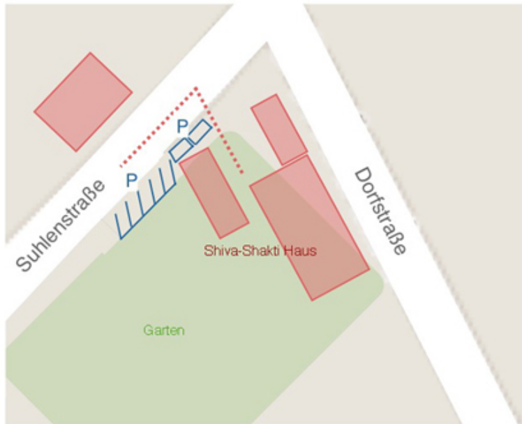
Parken am Haus mit Rücksicht auf die Nachbarn